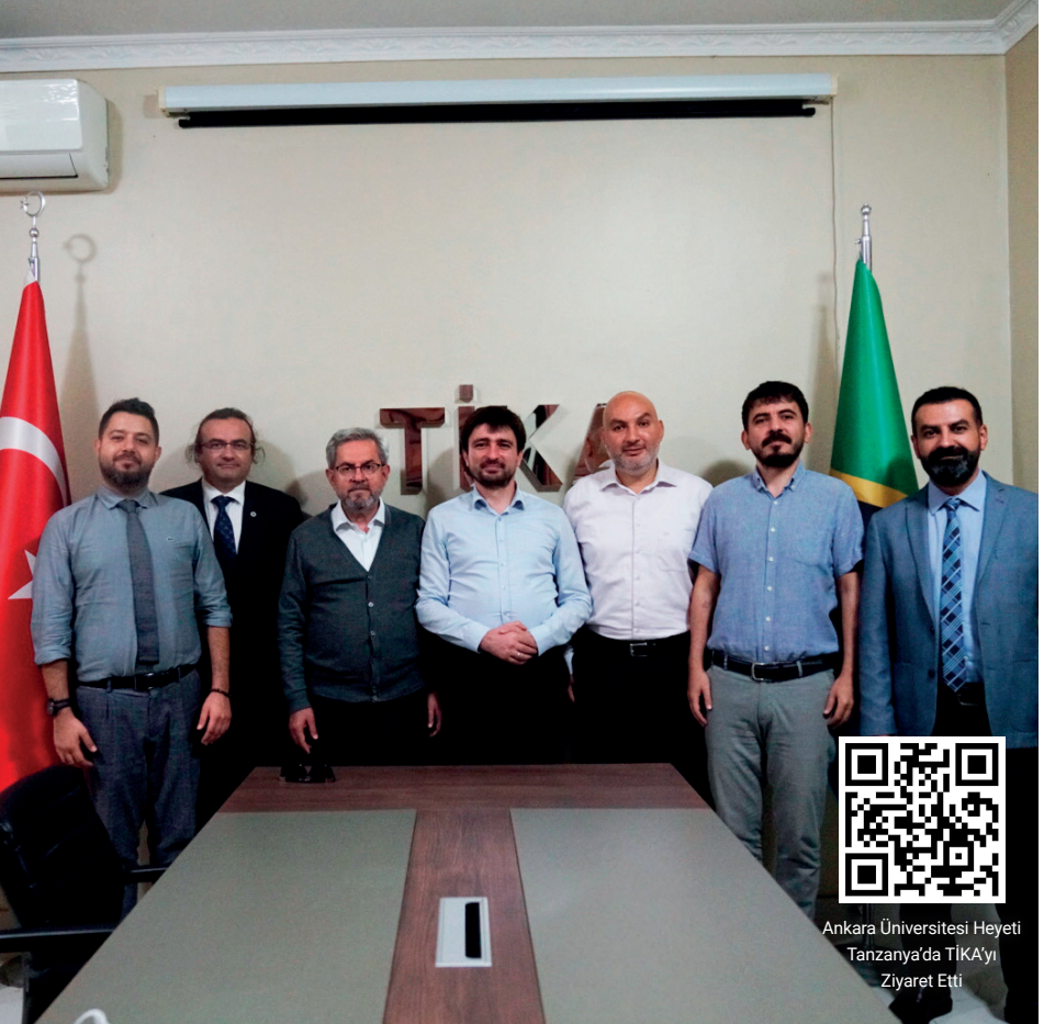
Ankara Üniversitesi Heyeti Tanzanya'da TİKA'yı Ziyaret Etti