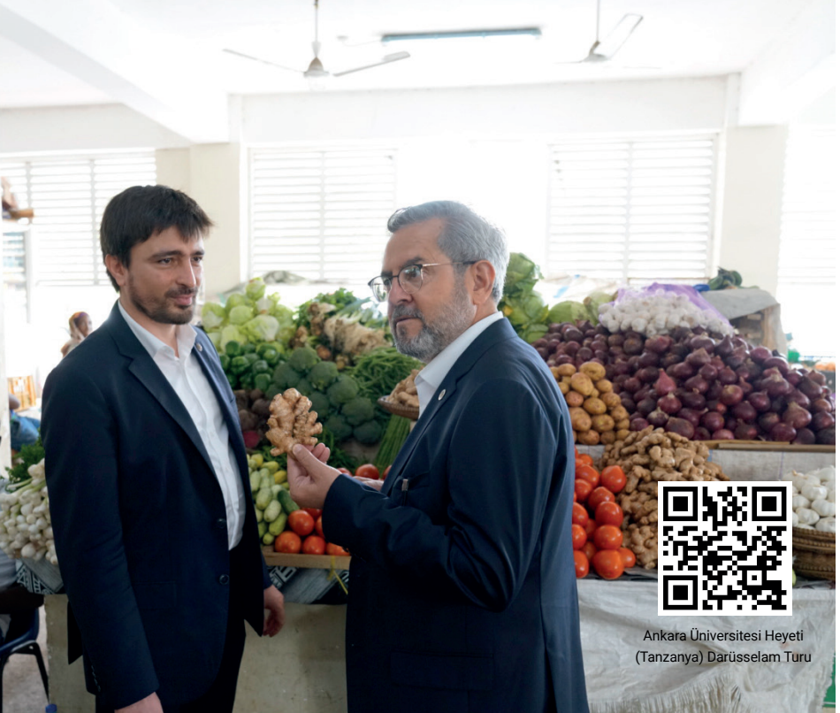
Ankara Üniversitesi Heyeti (Tanzanya) Darüsselam Turu